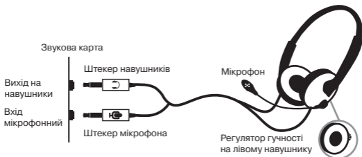
Мал. 1. Схема підключення