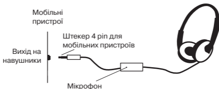
Мал. 1. Схема підключення