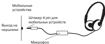
Рис. 1. Схема подключения