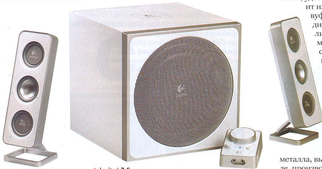
▲ Logitech Z-4

Хотя управление системой вынесено в отдельный блок, найти нужные регуляторы