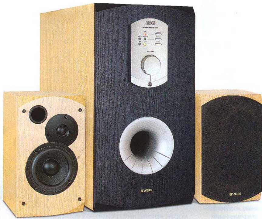
▲ SVEN B2-10

эт профессиональных и самодостаточных музыкантов, которые решили играть вместе. Громкость звука весьма приличная, но порой низкочастотный звук выводит JBL duet из спокойного состояния, и система искажает звучание. Также небольшие проблемы возникают у колонок с высокими нотами: они начинают пищать, отчего приходится морщиться, но только при условии, что регулятор громкости стоит на максимуме, а это само по себе ненормально. Система JBL подкупает своей простотой: всего лишь один регулятор громкости, что объясняется правильной настройкой басов и тембра. Колонки удобно размещаются на столе благодаря длинному проводу, который соединяет их с компьютером. Во всех проявлениях