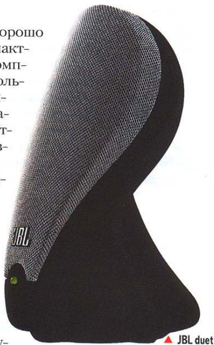
▲ JBL duet

Название системы полностью оправдывает себя: это действительно ду-