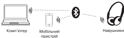
Мал. 2. Схема підключення