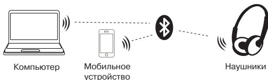
Рис. 2. Схема подключения