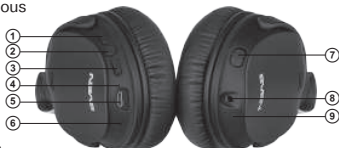
Fig. 1. Headphones design

⑨ LED indicator of active noise cancellation system (ANC)