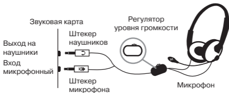
Рис. 1. Схема подключения